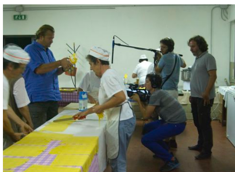
Festa della tagliatella a Ponticelli