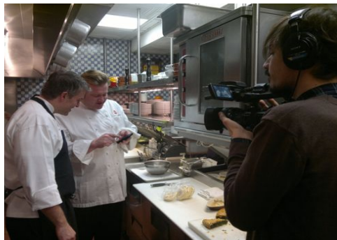
Cucina dell'"Osteria Morini" a New York