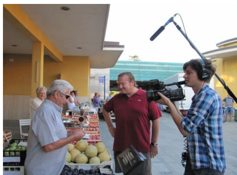
Al mercato ortofrutticolo di Imola